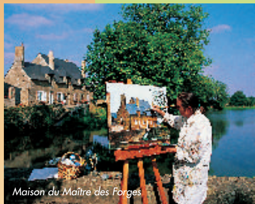
Maison du Maître des Forges

re un beau patrimoine bâti en schiste et en grès armoricain. Le sentier sillonne d'abord dans les sous-bois de chênes et de hêtres puis