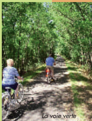
La voie verte

La Voie Verte. Une balade dépaysante au cœur de la campagne Castelbriantaise sur les 13 km de voie aménagée pour la pratique du vélo, du roller et les balades à pied. Départ de Châteaubriant ou de Rougé à 10 km. Rens. à l'Office de Tourisme.